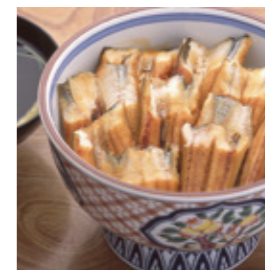
星饅飯 (飯上盛有醬油烤星饅的料理)